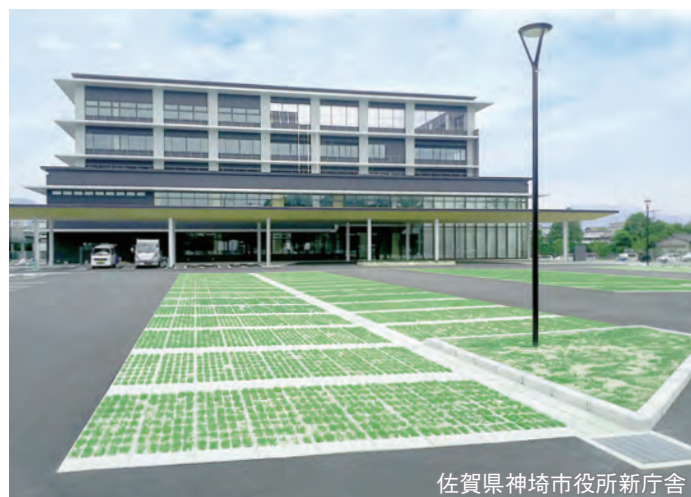
佐賀県神埼市役所新庁舎